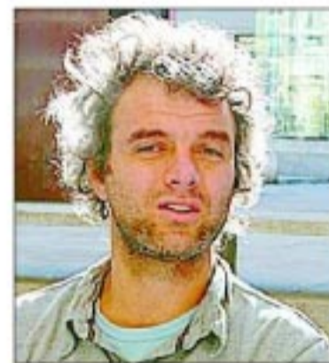
PIET HEIN EEK DISEÑADOR

Todos estos muebles han sido elaborados en el estudio-taller de Hein Eek a partir de trozos de madera desechados.